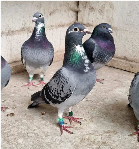
De 21-925, vijfde plaats, poseert graag voor onze fotograaf.

Sil over de opbouw van het seizoen: „Ik begon het jaar met 100 vliegduiven en ik kweek ook zo'n 80 jongen. Naast de vliegduiven heb ik 9 koppels kwekers. De ene helft van de vliegers is met de kerst gekoppeld en hebben de eerste ronde van de kwekers uitgebroed. De andere helft is 3 weken later gekoppeld en hebben de tweede ronde van de kwekers uitgebroed. De betere vliegers mogen hun eigen jongen groot brengen. Ook de winnende duivin heeft in die periode jongen groot gebracht.”